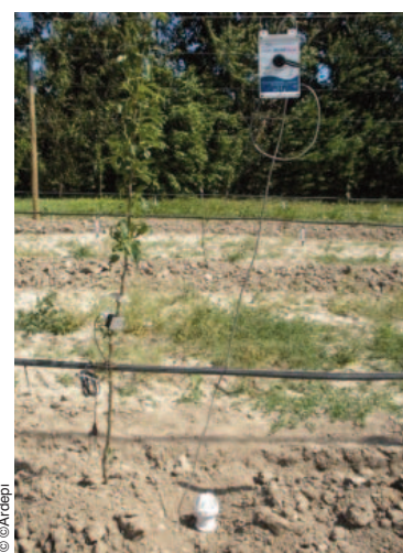
Sonde Enviroscan installée avec boîtier enregistreur.

Chaque couleur de courbes correspond à une profondeur de sol mesurée. Lorsque les courbes montent cela correspond à un apport d'eau de pluie ou d'irrigation. Lorsque les courbes baissent cela correspond à une diminution de l'eau dans le sol soit due à la consommation d'eau par les racines des plantes présentes soit à l'évaporation de l'eau par le sol, soit à l'infiltration de l'eau vers des horizons plus profonds.