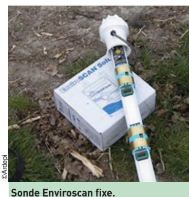
Sonde Enviroscan fixe.

Pour en savoir plus : www.ardepi.fr www.lapugere.com